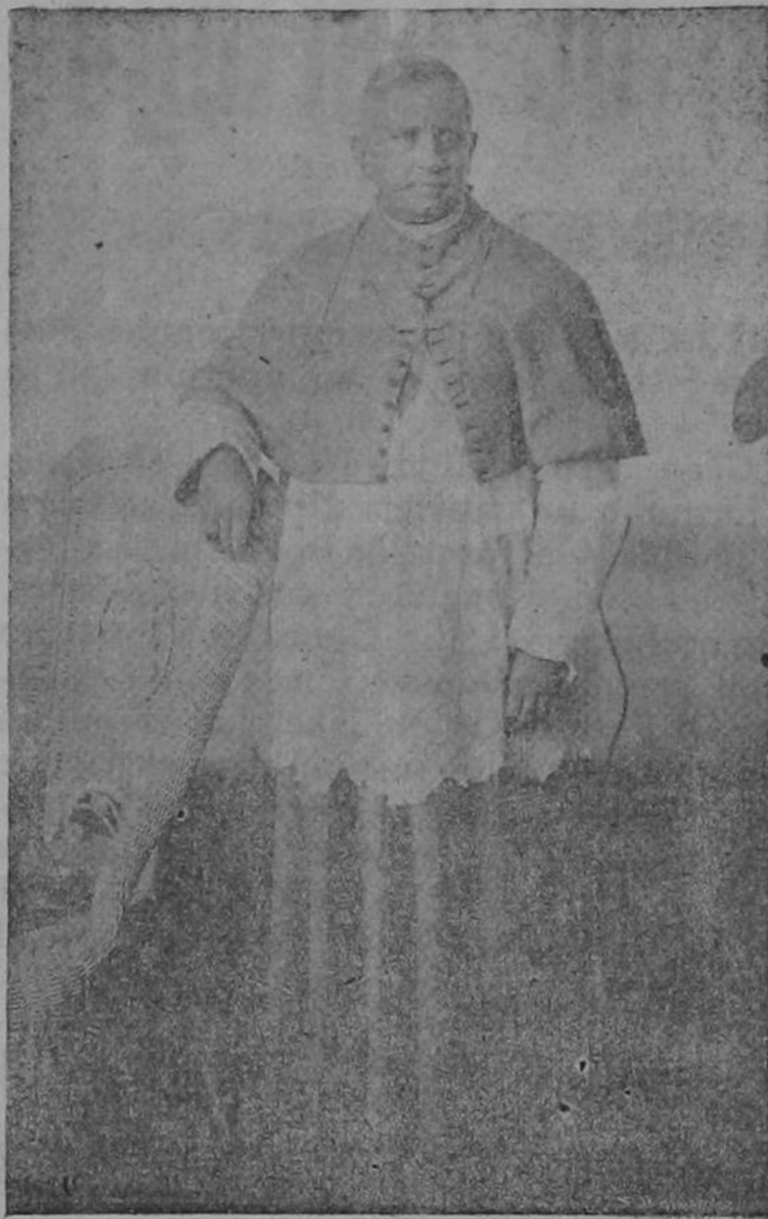
Monseñor Muñoz y Capurón

Quien dejó de existir el 24 de enero de 1927 en Bogotá a cuya memoria se celebrará una misa el martes próximo en la Iglesia de San Francisco