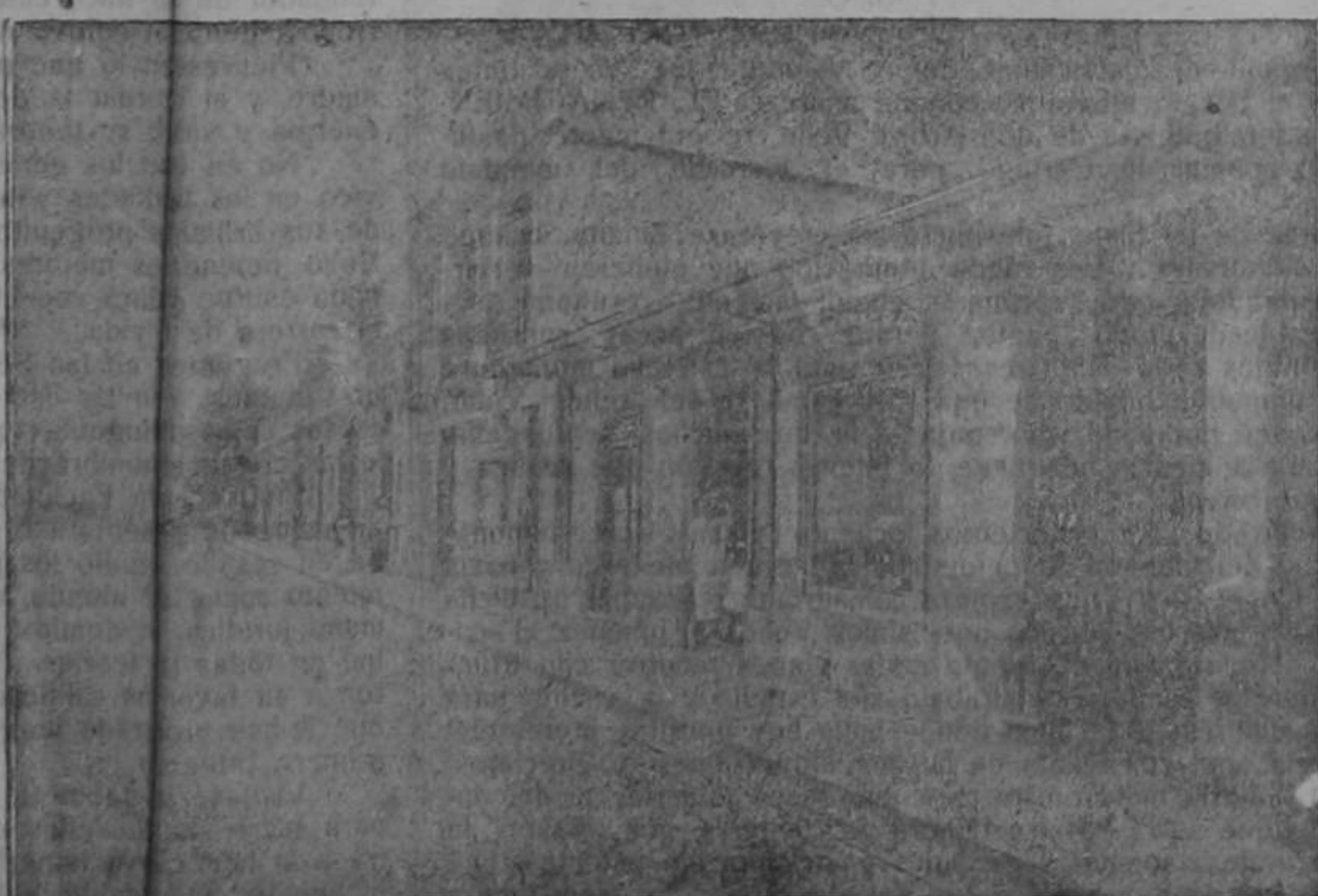
Edificio de la Casa matriz en Cartago

Está muy bien surtida. Fué establecida con el fin de favorecer a sus compradores, quienes encuentran en ella a más de sus mayores caprichos, un servicio exquisito en el trato y una complacencia única en sus empleados que atienden.