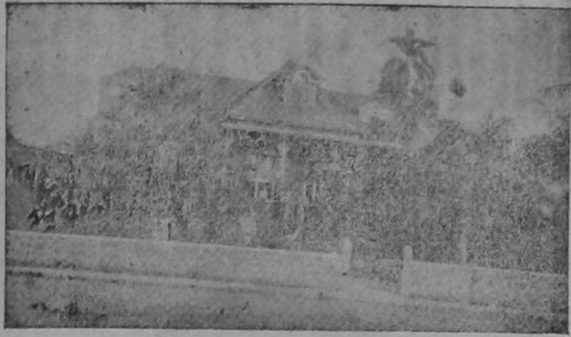
Casa de habitación de don Miguel Monge