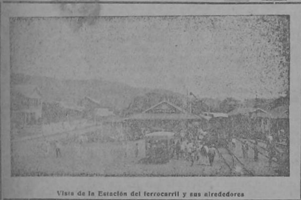
Vista de la Estación del ferrocarril y sus alrededores