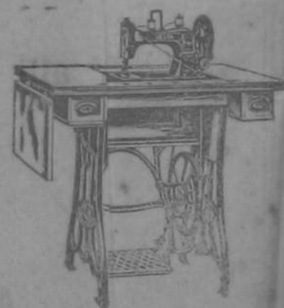
VESTA La única de dos marchas Ventaja insuperable 800 caras al Es. del Banco Rivera & Co Call del Comercio