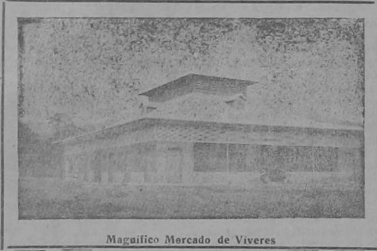
Magnifico Mercado de Viveres