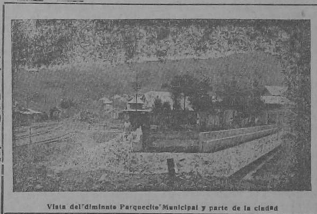
Vista del 'dilatado' Parque Municipal y parte de la ciudad